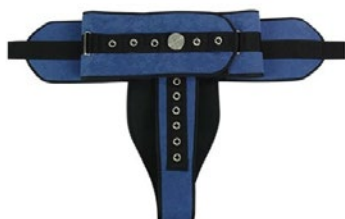
50-019_M Cinturón perineal cama 90 acolchado Cierre Iron-Clip