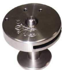
50-038 Botón Iron-Clip