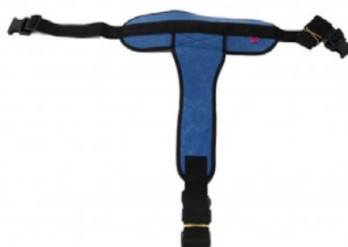
50-024 Cinturón perineal silla acolchado Cierre hebillas