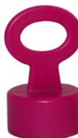
50-032 Llave imán