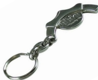
50-039 Llave Iron-Clip