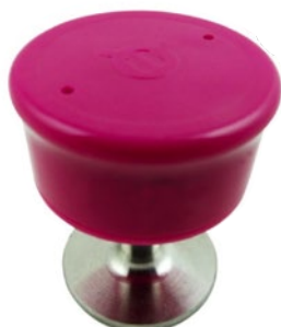
50-028 Botón imán