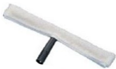
Mojador con soporte