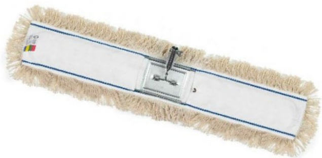
Mopa (repuesto + bastidor)