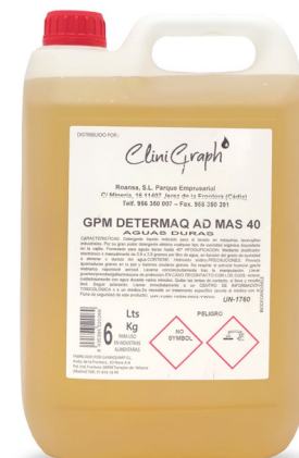
Detergente aguas duras Garrafa de 6L.