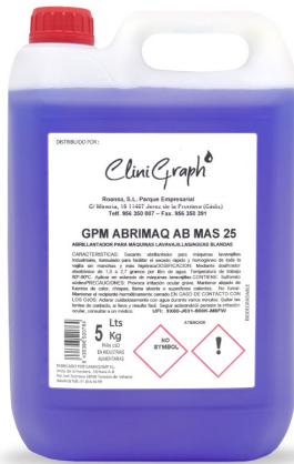
Abrillantador aguas blandas Garrafa de 5L.