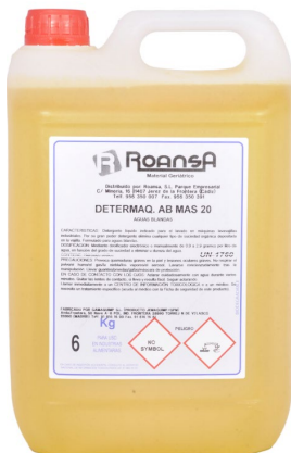
Detergente aguas blandas Garrafa de 6L.