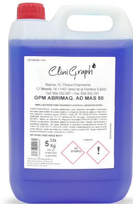
Abrillantador aguas duras Garrafa de 5L.